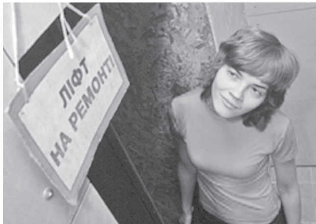
↑ В области возьмется за ремонт лифтов. Сегодня из имеющихся 4072 лифтов больше половины отработали нормативный срок эксплуатации (25 лет).