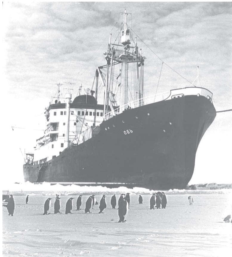
На дизель-электроходе «Обь» Алексей Трешников совершил кругосветное плавание в высоких широтах

ные события далекой жизни завораживали и привлекали меня», - писал Алексей Федорович.