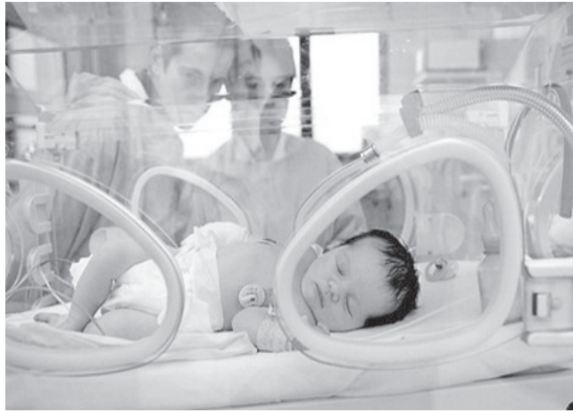
↑ В новый перинатальный центр в Ульяновской области планируется закупить более 2,5 тысячи единиц современного медицинского оборудования.