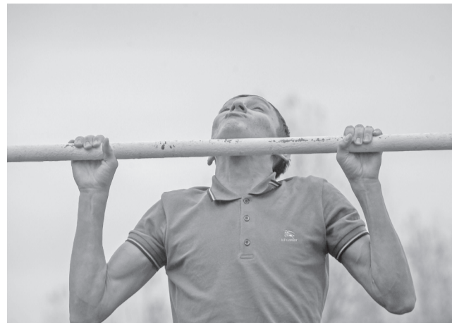
↑ До конца года обустроят три площадки тестирования физкультурно-спортивного комплекса «Готов к труду и обороне». На эти цели из федерального бюджета выделят 2,2 миллиона рублей.