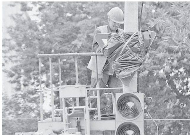
↑ С 28 апреля движение по проспекту Гая вдоль Винновской рощи станет двухсторонним. Для автомобилей будут открыты три полосы.