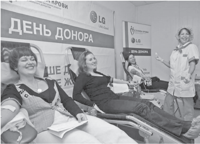
↑ «Суббота донора» пройдет на базе региональной станции переливания крови 18 апреля. Ежегодно 20 апреля в России отмечается Национальный день донора.