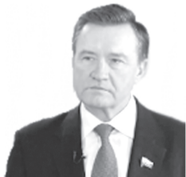
Сергей Рябухин, председатель Комитета Совета Федерации по бюджету и финансовым рынкам:

Если вы готовы решать проблемы ульяновцев и обладаете достаточным опытом и профессиональными навыками, «Единая Россия» приглашает вас принять участие в народном голосовании.